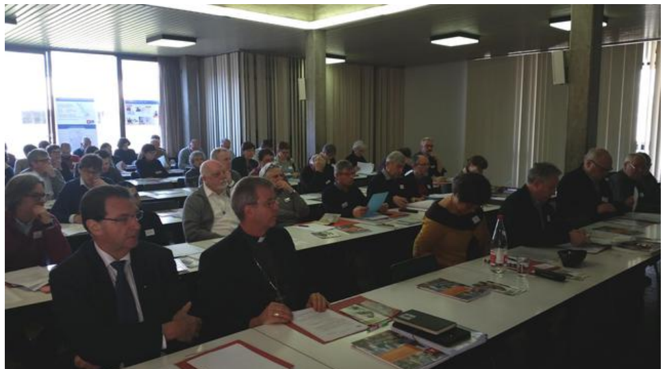
Een grote opkomst voor het IPB-Forum afgelopen zaterdag in het Antwerpse TPC

Het forum opende met drie getuigenissen waaruit bleek dat de uitwerking van een kerkenbeleidsplan en de beslissing over de mogelijke sluiting van een parochiekerk lang niet altijd van een leien dakje loopt. Zeker als geëngageerde parochianen het gevoel krijgen dat alles over hun hoofden heen en dus zonder enige vorm van inspraak en dialoog gebeurt.