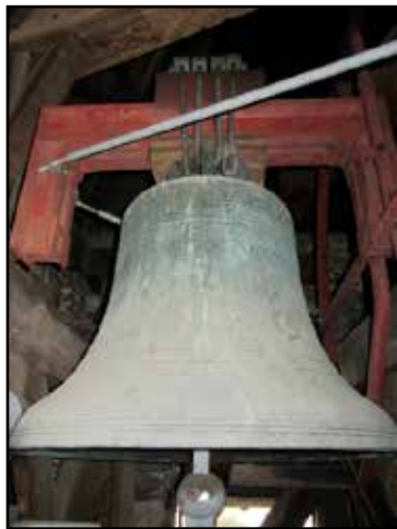
Krukas in U-vorm